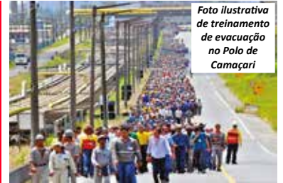
Foto ilustrativa de treinamento de evacuação no Polo de Camaçari

Incidente resultou em evacuação de várias empresas/unidades do polo de Camaçari/BA